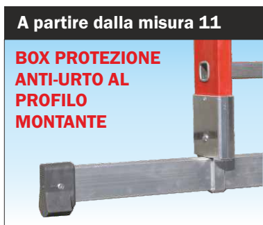
Basetta stabilizzatrice d'alluminio con box di protezione al profilo con montaggio e lo smontaggio rapido