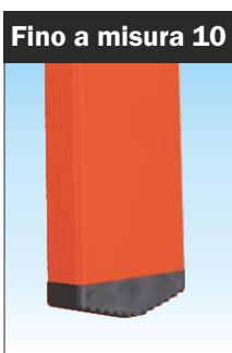
Piedino di appoggio fissato con innesto anti-distacco